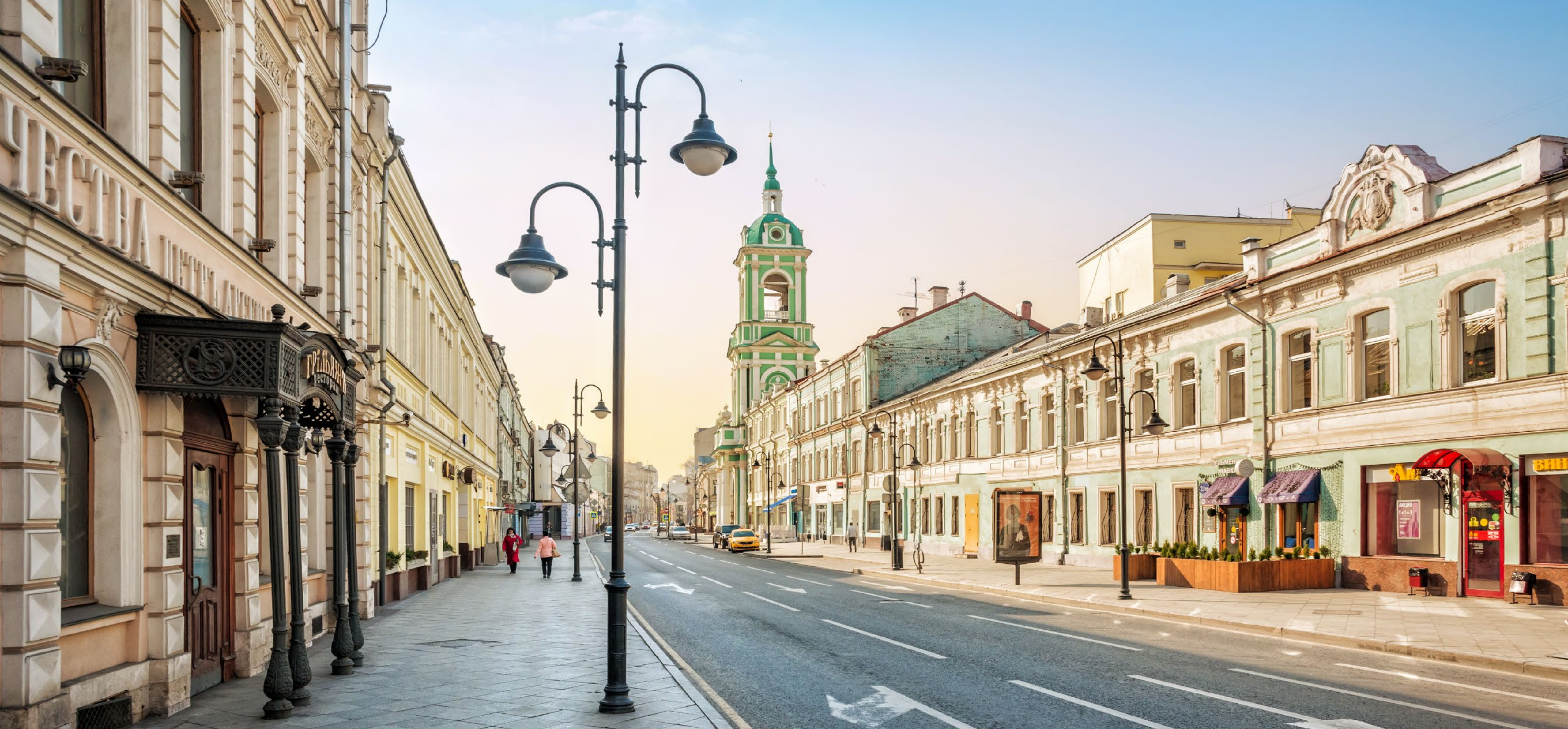
Проект строительства особняка на Пятницкой ул., 40